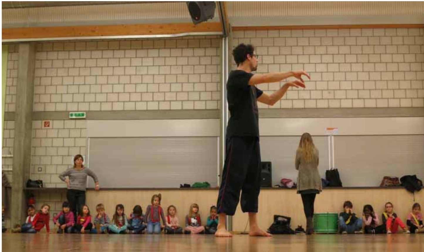
Les enfants apprennent à se glisser dans la peau des animaux qu'ils ont inventés.