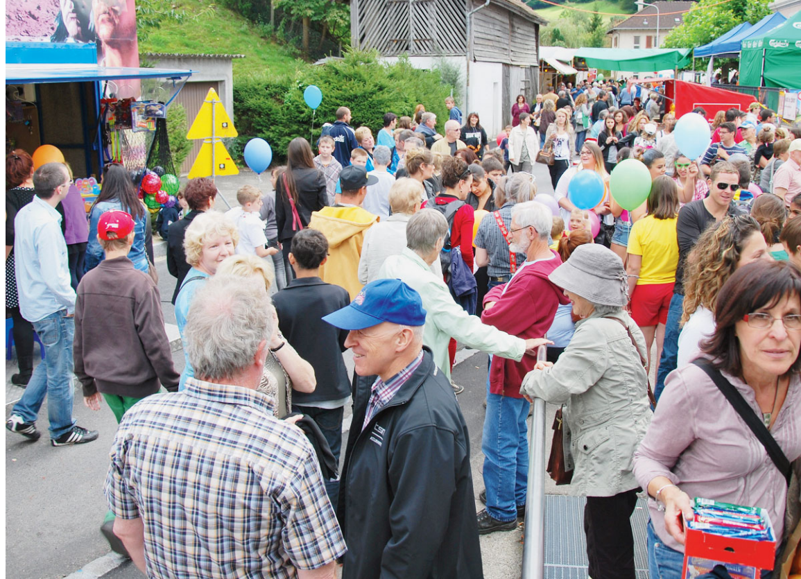
Les organisateurs de la Fête du Grand Val attendent entre 3000 et 4000 personnes cette année.