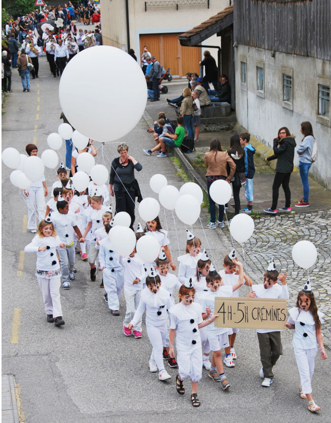
Le cortège, un moment toujours très apprécié du public.