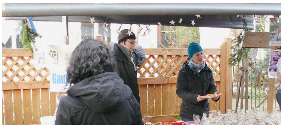
Le marché d'automne de Champoz représente une importante vitrine pour les produits du terroir.