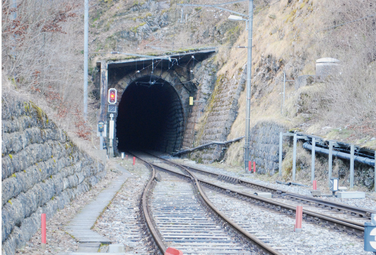
Le tunnel du Weissenstein aura droit à une nécessaire cure de jouvence. Par endroits, des chutes de pierres menacent. MATTHIEU HOFFMANN

L'OFT a officiellement annoncé hier que la Confédération engageait un montant de 85 millions de fr. pour ces importants travaux de rénovation – et au total sans doute plus que 100 millions en ajoutant d'autres aménagements sur l'ensemble de la ligne. Les travaux démarreront normalement en 2020 et dureront deux ans. Dès sa réouverture,